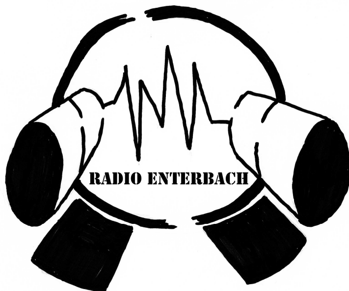
Radio Enterbach 95,0 Mhz